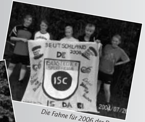
Die Fahne für 2006 der Damen.