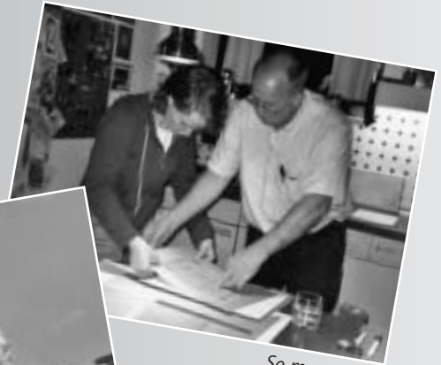
So muss das...!