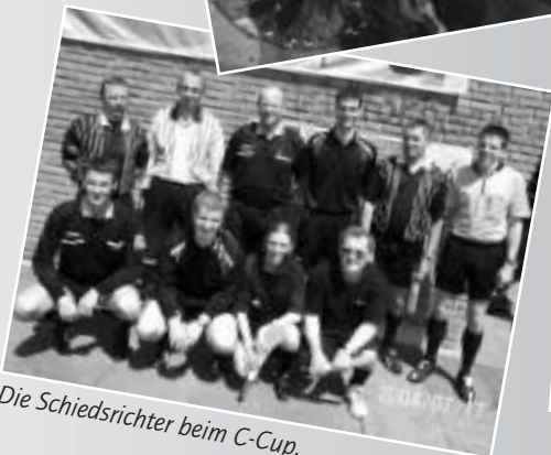
Die Schiedsrichter beim C-Cup.