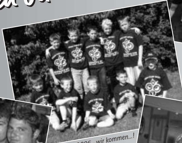
2006 - wir kommen...!