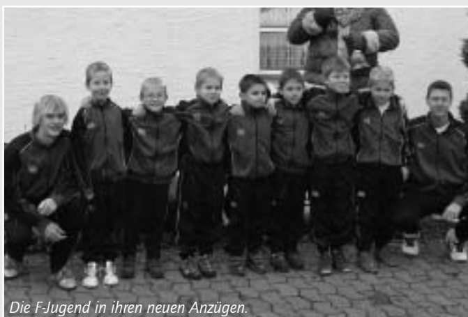
Die F-Jugend in ihren neuen Anzügen.

Am 11. September 2004 begann unsere Saison und gleich zu Anfang setzte es bei strömendem Regen eine 8:1 Niederlage in Levern. Nach diesem ersten Rückschlag arbeiteten wir weiter mit den Spielern, um ihre individuellen Fähigkeiten zu verbessern. Schon nach einer Woche wurde dies mit einem 6:1 gegen Preußisch Oldendorf belohnt und auch das Spiel gegen Frotheim gewannen wir klar mit 5:1. Am Mittwoch, den 29.9., kassierten wir gegen Gehlenbeck erneut 8 Tore und verloren 8:2 gegen die wohl stärkste F-Jugend-Mannschaft im Fußballkreis Lübbecke. Zum Glück konnten wir in Varl wieder einmal die Oberhand gewinnen und siegten erneut mit 5:1. Zum Abschluss der Hinserie gab es in Stemwede leider nur ein unglückliches 1:1 Unentschieden.